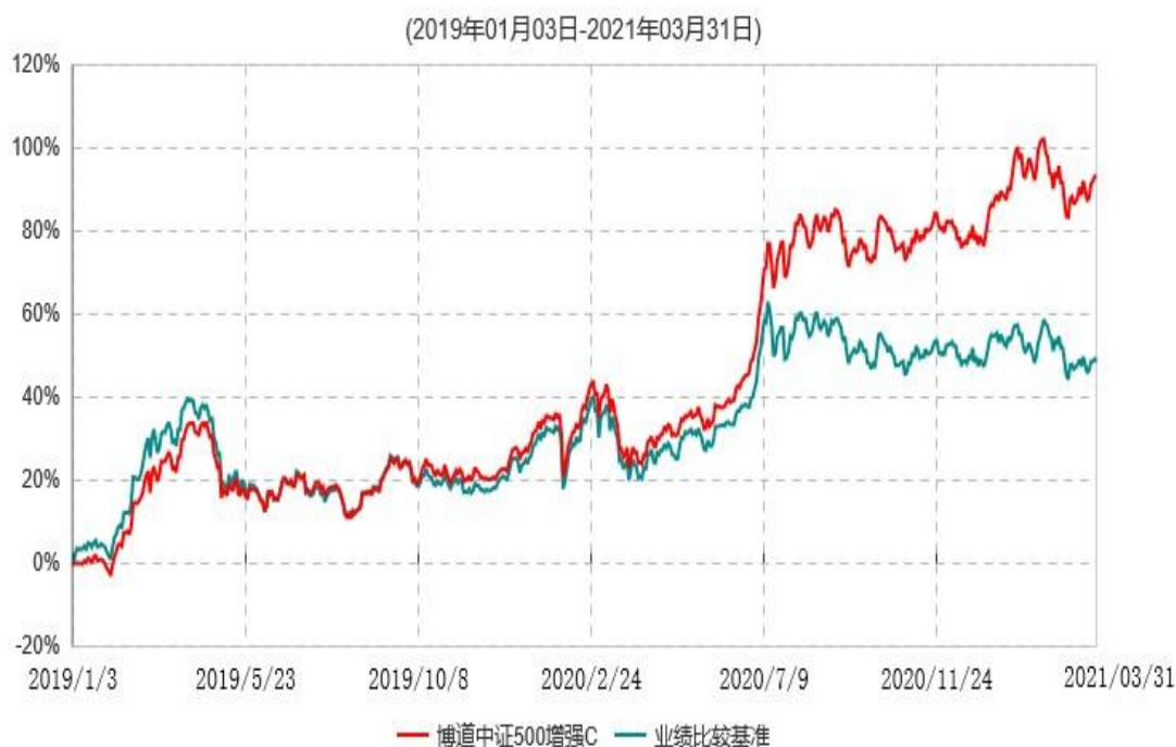
博道中证500增强C累计净值增长率与业绩比较基准收益率历史走势对比图

注：本基金建仓期为自基金合同生效日起的 6 个月。截至建仓期结束，本基金各项资产配置比例符合基金合同及招募说明书有关投资比例的约定。