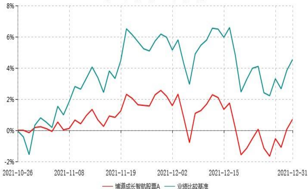
博道成长智航股票A累计净值增长率与业绩比较基准收益率历史走势对比图 (2021年10月26日-2021年12月31日)

注：本基金基金合同生效日为2021年10月26日，建仓期为自基金合同生效日起的6个月。基金合同生效日至报告期期末，本基金尚处于建仓期，且运作时间未满一年。