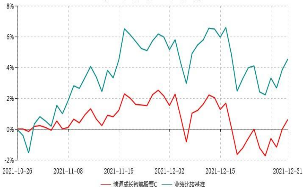
博道成长智航股票C累计净值增长率与业绩比较基准收益率历史走势对比图 (2021年10月26日-2021年12月31日)

注：本基金基金合同生效日为2021年10月26日，建仓期为自基金合同生效日起的6个月。基金合同生效日至报告期期末，本基金尚处于建仓期，且运作时间未满一年。