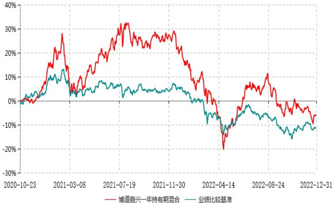
博道嘉兴一年持有期混合型证券投资基金累计净值增长率与业绩比较基准收益率历史走势对比图 (2020年10月23日-2022年12月31日)