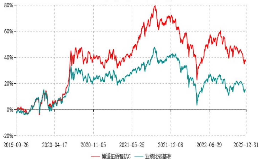
博道伍佰智航C累计净值增长率与业绩比较基准收益率历史走势对比图 (2019年09月26日-2022年12月31日)

注：本基金建仓期为自基金合同生效日起的6个月。截至建仓期结束，本基金各项资产配置比例符合基金合同及招募说明书有关投资比例的约定。