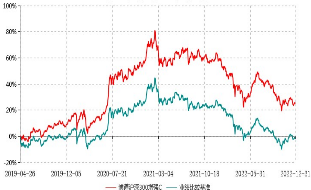
博道沪深300增强C累计净值增长率与业绩比较基准收益率历史走势对比图 (2019年04月26日-2022年12月31日)

注：本基金建仓期为自基金合同生效日起的6个月。截至建仓期结束，本基金各项资产配置比例符合基金合同及招募说明书有关投资比例的约定。