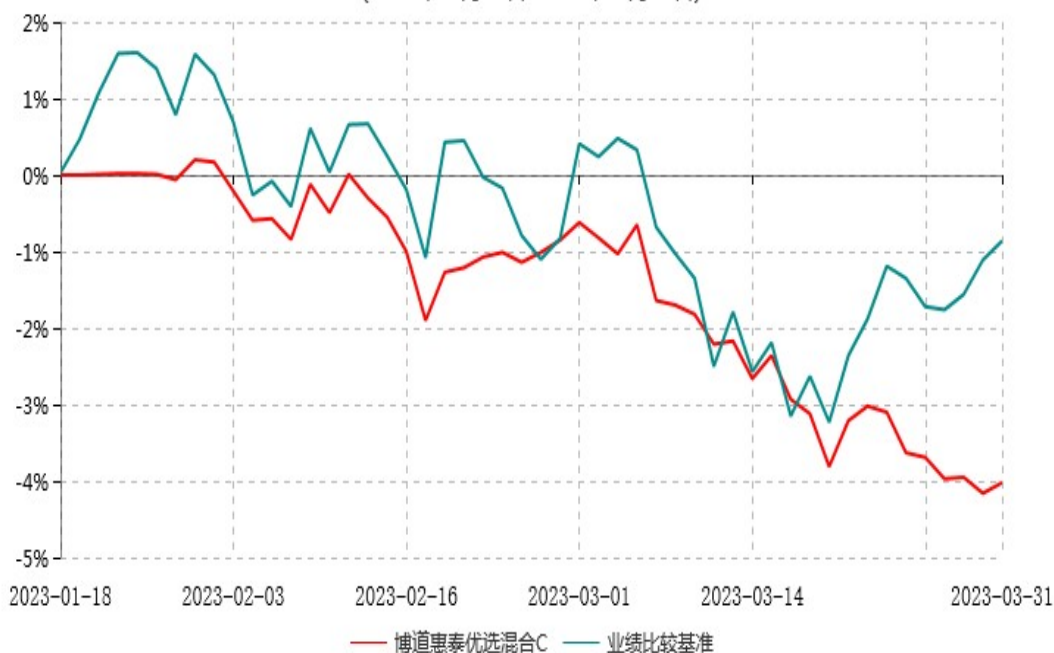
博道惠泰优选混合C累计净值增长率与业绩比较基准收益率历史走势对比图 (2023年01月18日-2023年03月31日)

注：本基金基金合同生效日为 2023 年 1 月 18 日，建仓期为自基金合同生效日起的 6 个月。基金合同生效日至报告期期末，本基金尚处于建仓期，且运作时间未满一年。