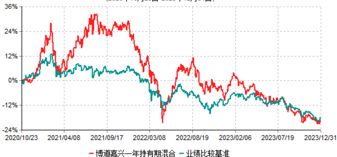
博道嘉兴一年持有期混合型证券投资基金累计净值增长率与业绩比较基准收益率历史走势对比图 (2020年10月23日-2023年12月31日)

注：本基金建仓期为自基金合同生效日起的6个月。截至建仓期结束，本基金各项资产配置比例符合基金合同及招募说明书有关投资比例的约定。