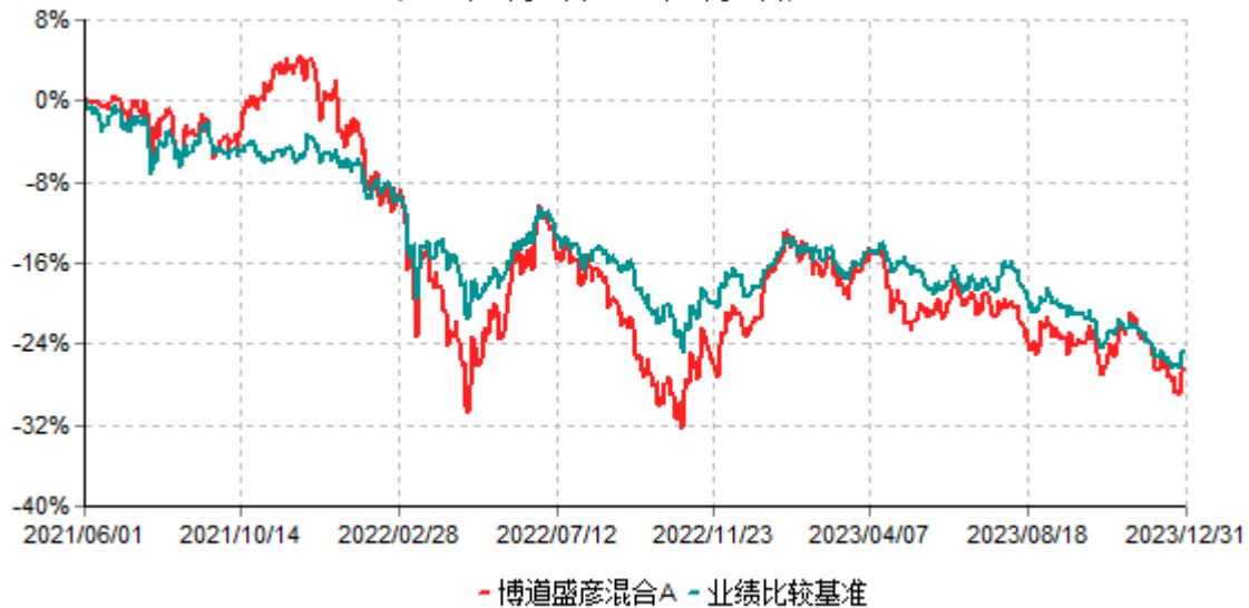
博道盛彦混合A累计净值增长率与业绩比较基准收益率历史走势对比图 (2021年06月01日-2023年12月31日)

注：本基金建仓期为自基金合同生效日起的6个月。截至建仓期结束，本基金各项资产配置比例符合基金合同及招募说明书有关投资比例的约定。