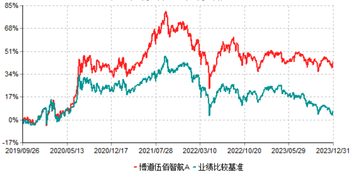
博道伍佰智航A累计净值增长率与业绩比较基准收益率历史走势对比图 (2019年09月26日-2023年12月31日)

注：本基金建仓期为自基金合同生效日起的6个月。截至建仓期结束，本基金各项资产配置比例符合基金合同及招募说明书有关投资比例的约定。