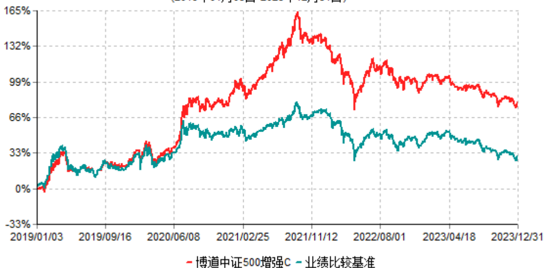
博道中证500增强C累计净值增长率与业绩比较基准收益率历史走势对比图 (2019年01月03日-2023年12月31日)

注：本基金建仓期为自基金合同生效日起的6个月。截至建仓期结束，本基金各项资产配置比例符合基金合同及招募说明书有关投资比例的约定。