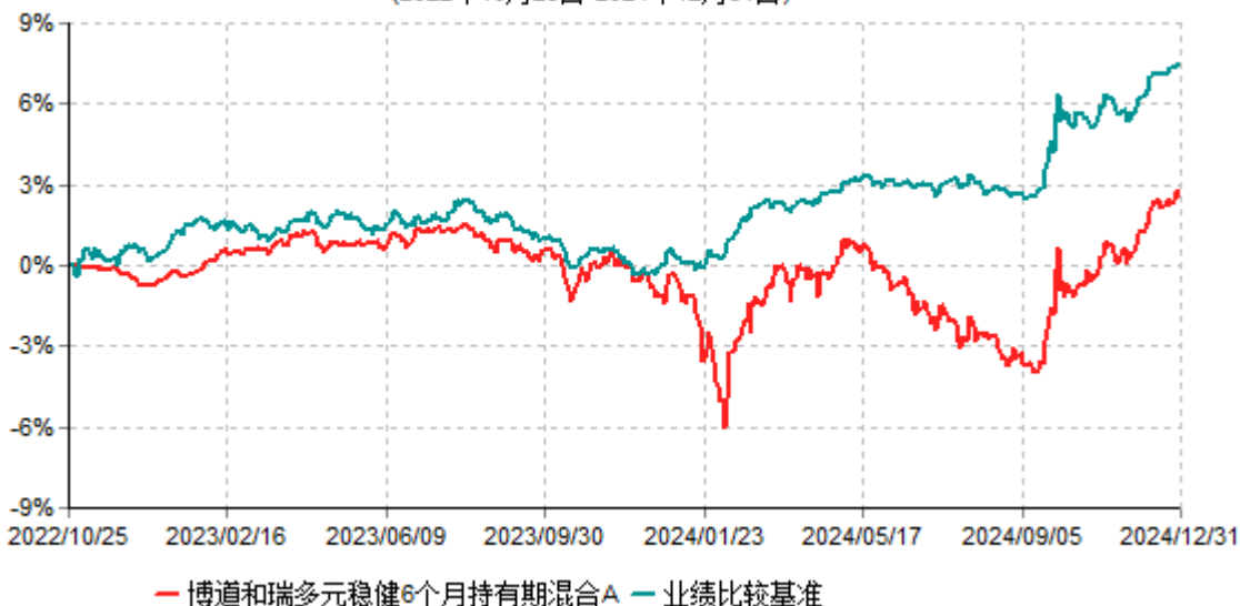
博道和瑞多元稳健6个月持有期混合A累计净值增长率与业绩比较基准收益率历史走势对比图 (2022年10月25日-2024年12月31日)

注：本基金建仓期为自基金合同生效日起的6个月。截至建仓期结束，本基金各项资产配置比例符合基金合同及招募说明书有关投资比例的约定。